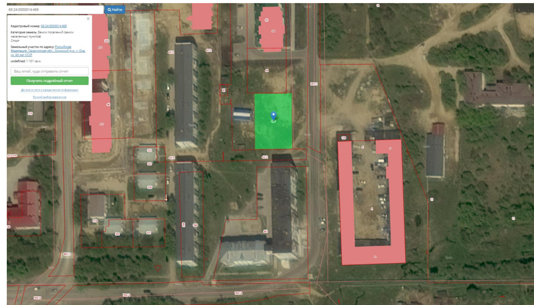
Схема размещения земельного участка на публичной кадастровой карте

Российская федерация, сахалинская область, Охинский район, г. Оха, ул. 60 лет СССР.